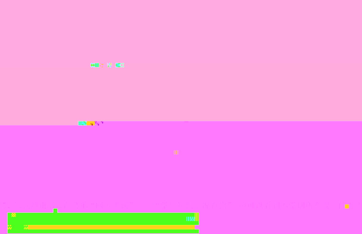
图 3-10 地形剖面图